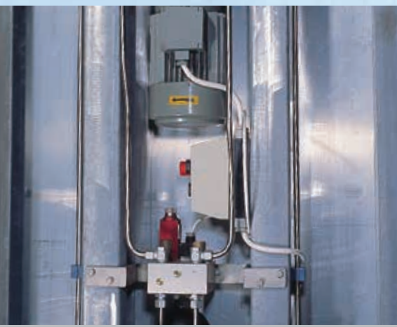
Гидравлическая станция, модель Power Pack, смонтированная на скороморозильном аппарате.