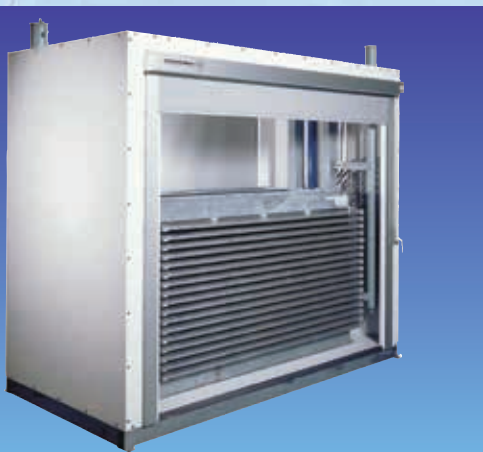
DSI Горизонтальный скороморозильный аппарат со шкафом из сэндвич-панелей